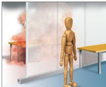
EI = Celistvost a Izolace